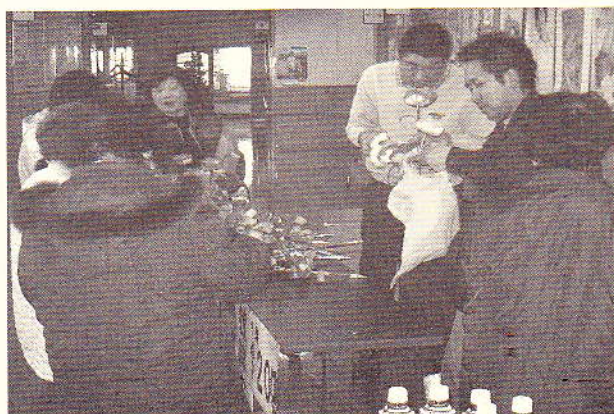
▲彼岸花を販売するまつくらの人達。

まつくらでは、このような作業を通じて利用者の社会参加を進め、仕事への能力を高めています。