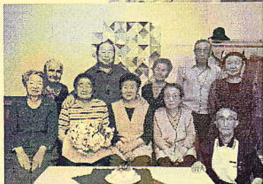
誕生日を祝う 記念写真←