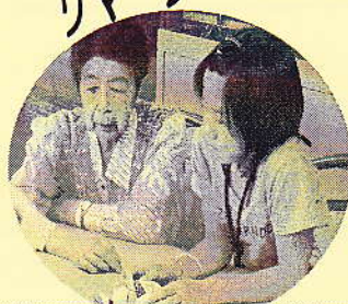
延寿庵利用者との交流。一緒にゲームをしたり、お話ししたりと、楽しい時間を過ごしました。

小学生（5・6年）、中学生が夏休み中に施設や社協でボランティア活動に挑戦しました。 参加者は貴重な体験に目を輝かせていました。