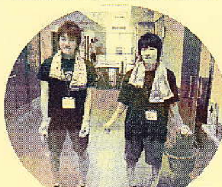
真森苑のすみからすみまで掃除しましたっ！