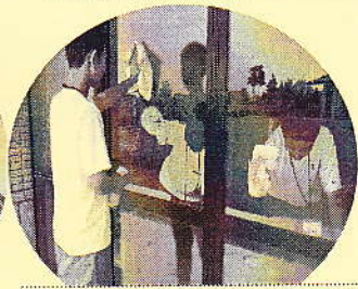
男3人、力を合わせたら鏡のようにピッカピカ〜♪