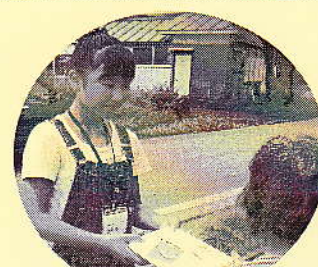
社協の配食サービスでお弁当をお届けしました。かわいい配達員に利用者もおもわずニコリ♥