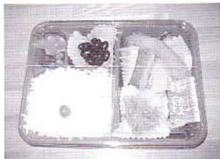
▲できたてのお弁当が届けられます

を対象としています。定期的に訪問し、栄養のバランスのとれた食事を届けると同時に利用者の安否確認を行います。食の自立支援事業では各地域でお弁当を届けてくれるボランティアを募集しています。皆さんのご参加をお待ちしています。