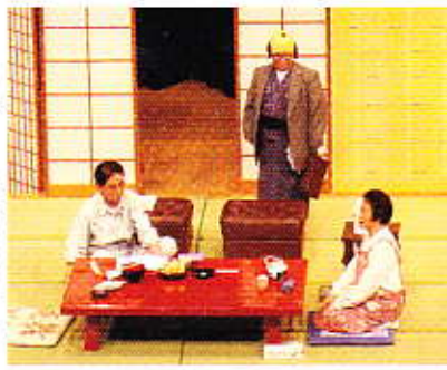
▲大曲婦人会 助けあい演芸会