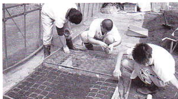
▲まつくらでは近所の農家へも就労に出かけています