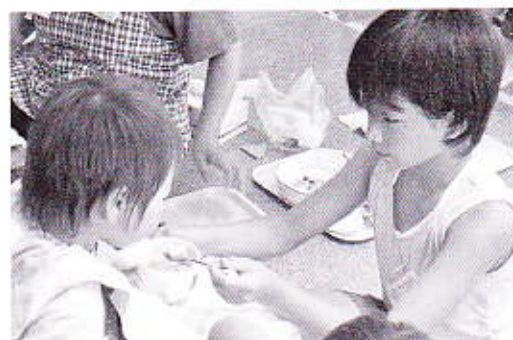
▲保育園でのボランティア（昨年の活動から）