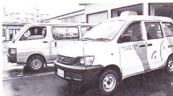
▲訪問入浴には入浴車でお伺いします