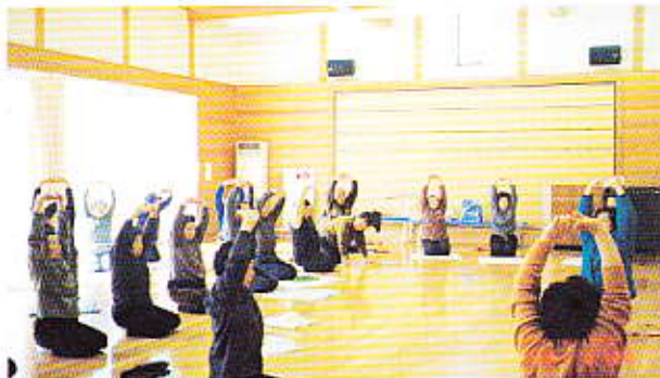
ふれあいいきいきサロンで健康体操 (太田支所)