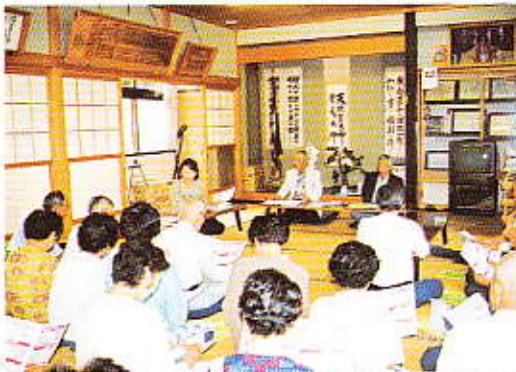
地域支えあい事業は、町内会単位での高齢者や障がい者等の見守り活動や交流事業を支援する事業です。(西仙北支所)

地域の実情に応じて事業を実施して いますので詳細については、各支所 にお問い合わせください。