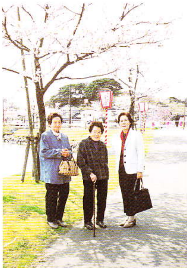
▲満開の桜の前でハイ！チーズ!!