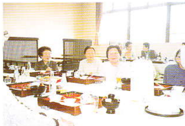
▲おいしい食事と親しい仲間が集まれば、自然と話も弾み笑顔があふれます