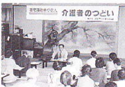
▲家族介護者交流事業