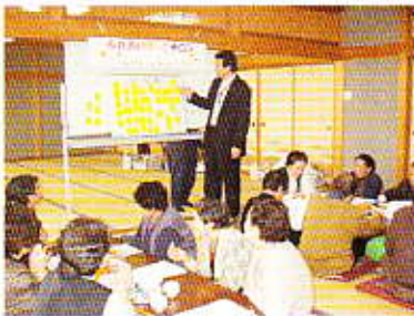
ふれあい・いきいきサロン(仙北支所)で介護予防!

高齢者への福祉サービスの提供のほか、子育てサロン事業やエンゼル事業など若年層を対象とした事業等も行い、地域住民のネットワーク強化を図ります。