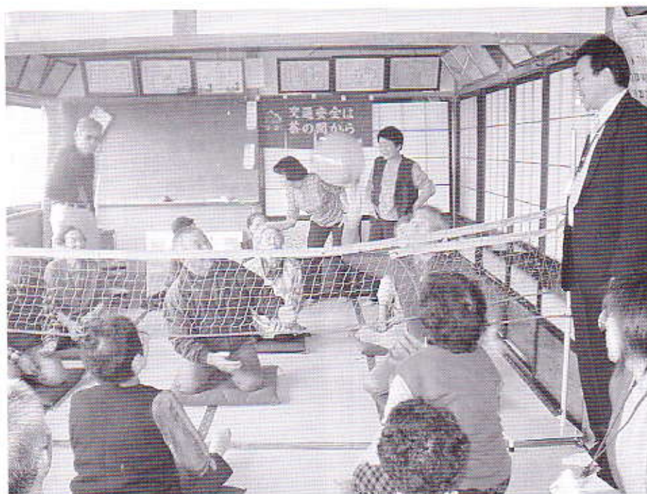
▲お腹の底から歓声が出ます。風船バレーボール

TEL 0187-63-0277 FAX 0187-62-8008 HP http://daisen-syakyo.jp/