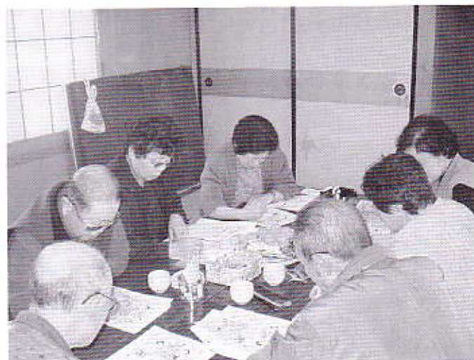
▲頭をフル回転 間違い探しゲーム

大仙市社会福祉協議会仙北支所では、平成十六年度よりお年寄りが閉じこもりがちになる冬期間に単位老人クラブごとに年数カ所を指定して「ふれあいほっとサロン」を開いています。 この事業は、赤い羽根共同募金を財源として行われているもので、看護師による健康チェック、簡単な工作やストレッチ体操、風船バレーボール、歌声喫茶と誰でも気軽に参加して心と体のリフレッシュを図ることが出来ます。 今年度は、仙北地域内の五カ所で行われ、合わせて約百名のお年寄りが参加しました。