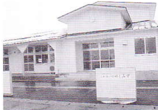
中仙地域清水の旧清水保育所を改修し、障がい者の自立のための施設を開所します