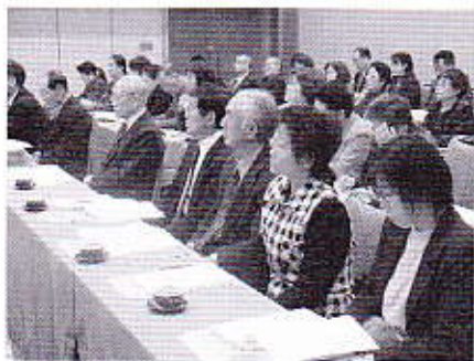
▲福祉関係者約100名が熱心に研修

ついて」と題し、講演が行われ総合生活支援(トータルケア)の先進地の例を挙げながら「いま地域で何が問題なのかをみんなで一緒に見つけ出して、その問題を整理し、解決に向けてともに支えあいながら行動することが大切です」と話されました。