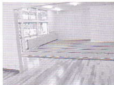
室内も明るくピカピカになりました (作業指導室)

大仙市社会福祉協議会では、 国・県・市の援助を得て中仙 地域清水に障がい者のための 支援施設を開所します。今年 四月に開設するこの施設は、 知的障がい者の地域での自立 を目的に「障害者自立支援法」 に基づいて支援サービスを行 う施設です。実施するサービ スは次のとおりです。