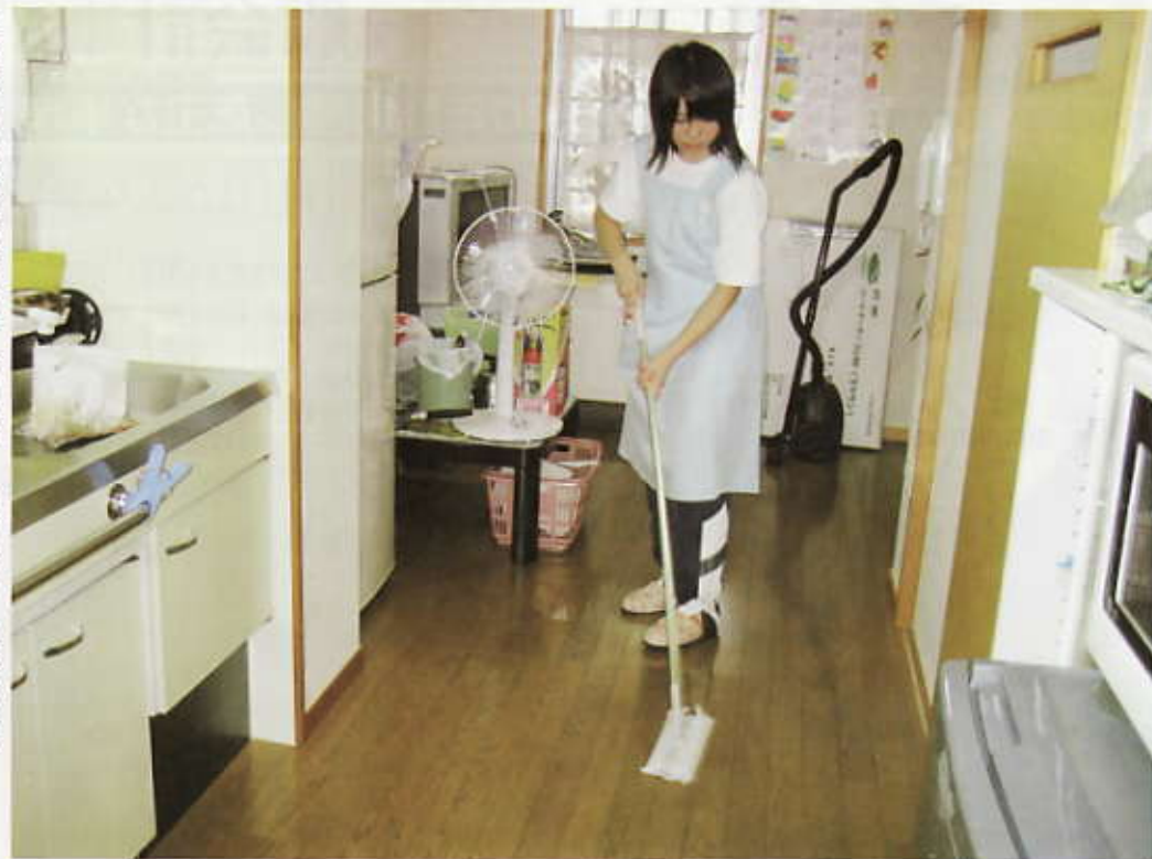
▶高校生の介護現場実習（2級ホームヘルパー養成講習）