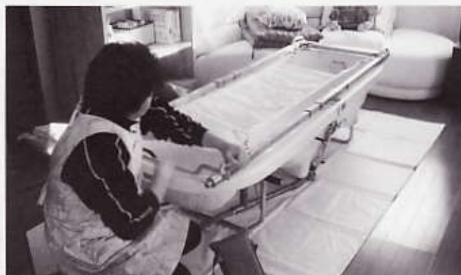
▲訪問入浴サービスの準備