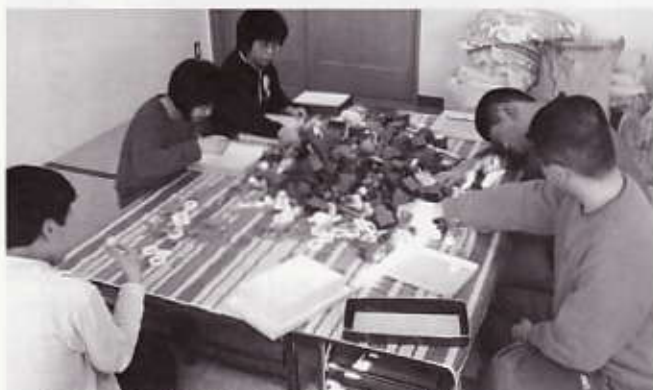
▲ポリバック（果物等を包む緩衝材）作業