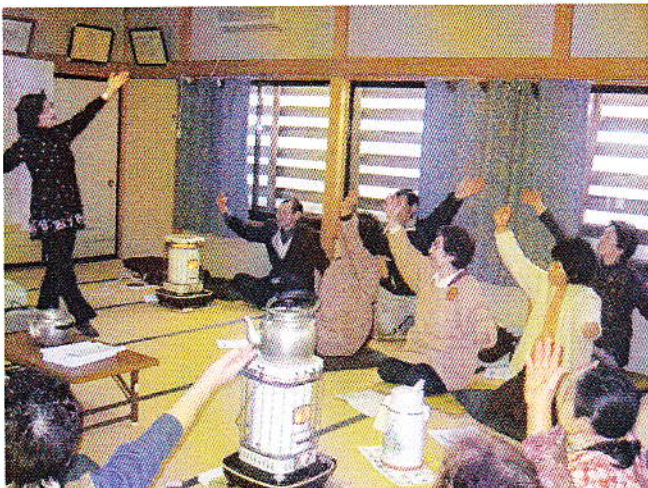
▲笑顔あふれるまちづくりを進める会による「出張うたごえサロン(秋通り)」